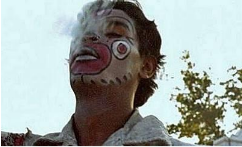
Guadalajara, Jalisco México 1977